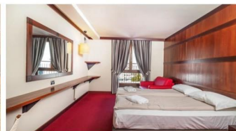
Tariffa per persona in trattamento di mezza pensione, acqua e vino inclusi alla cena